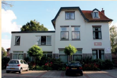
Hospicehuis El Ombū

Familieleden of andere mantelzorgers kunnen overnachten bij de gastbewoner op de kamer of in een eigen logeerkamer.